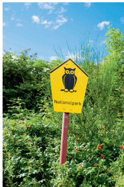
Abb. 5 Ein Vielen vertrauter Anblick. Das Schild weist darauf hin, dass die Natur hier besonders schützenswert erscheint.

gewonnen: Angst und Anspannung (A), Depression und Niedergeschlagenheit (D), Wut und Aggressivität (W), Müdigkeit (F), Verwirrtheit (C) und Vitalität (V). Insgesamt zeigte die Studie, dass der Aufenthalt im Wald die Konzentration des Stresshormons Cortisol im Blut, den Puls und den Blutdruck vermindert.